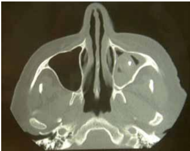
Figura 2. TC de face apresentando espessamento do revestimento mucoso do seio maxilar esquerdo e massa de densidade de partes moles com calcificações.