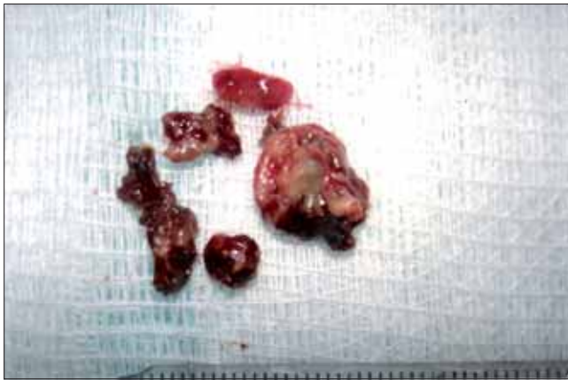
Figura 1. Peça cirúrgica pós sinusotomia maxilar.