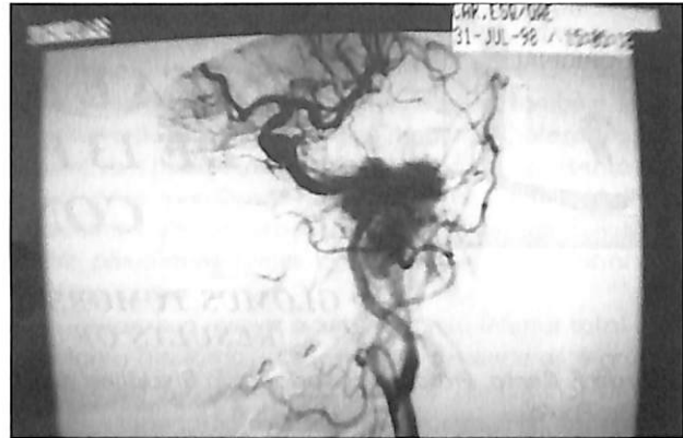
Figura 2. Angiografia de paciente com glômus jugular pré-embolização do tumor.