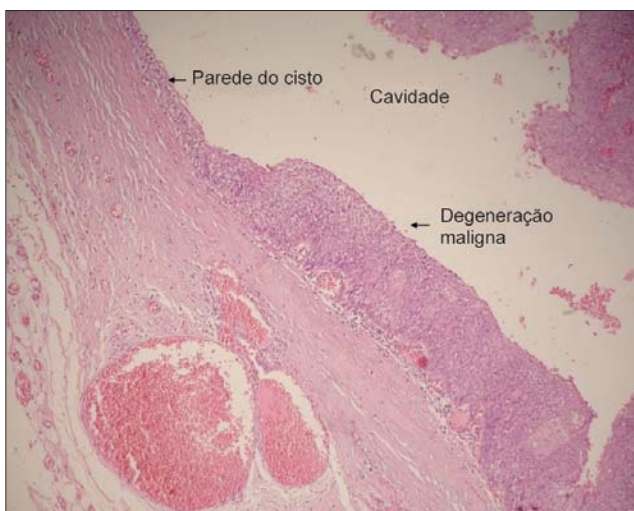
Figura 1. Cisto branquial malignizado - ultra-sonografia cervical mostrando cisto em porção ínfero posterior da parótida direita.